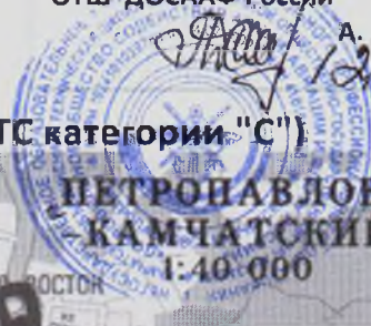
СХЕМА УЧЕБНОГО МАРШРУТА №1 (ТС категории "С")